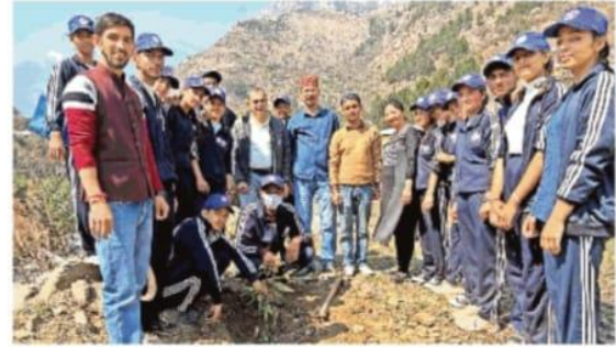
सैंज कालेज में आयोजित एनएसएस शिविर के तीसरे दिन पौधरोपण कार्यक्रम के दौरान मेज़ूद स्वयंसेवी